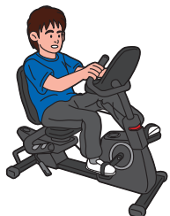
エアロバイクで手軽に有酸素運動