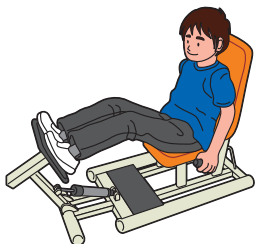
膝や股関節の筋肉を鍛えます